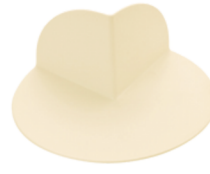
HIFAX (slonová kost)