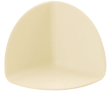
HIFAX (slonová kost)